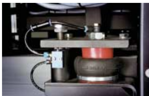
Un exclusivo sistema de suspensión neumática de cuatro puntos asegura una filmación precisa.

Cada sistema :Polaris X está basado en la fiabilidad sólida de Agfa :Polaris, que ya es la solución de ordenador a plancha líder del mercado para periódicos, añadiendo nuevas y extensas prestaciones y características de diseño inteligentes. Resultado: la familia :Polaris proporciona una fiabilidad excepcional y un alto nivel de automatización, para reducir el coste total de sus operaciones. Si equipa su sistema :Polaris X con un cabezal láser violeta, podrá reducir incluso más el coste de sus operaciones, puesto que este láser de larga duración está diseñado para durar tanto como el sistema, eliminando así la necesidad de una costosa sustitución de los cabezales láser térmicos.