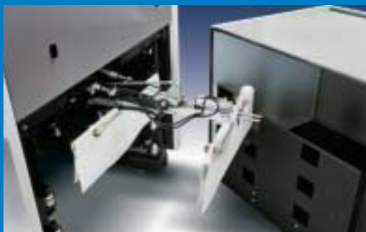
El sistema de brazo oscilante retira el papel de separación con fiabilidad y rapidez