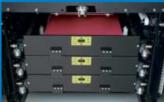
Tres cassettes para mantener en línea una amplia gama de planchas